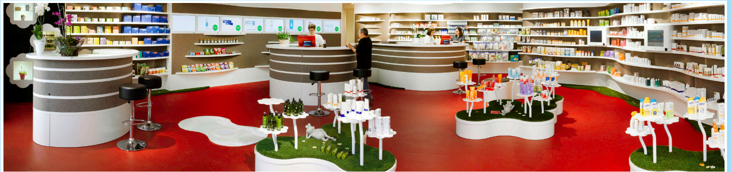
Markus Sailer, www.datenschutz-apo.de | Bruckbergerstr. 97, 91522 Ansbach

Ja, die DS-GVO ist lästig, sie birgt aber auch viele Chancen auf Verbesserungen, die ich mit Ihnen gemeinsam bergen möchte.